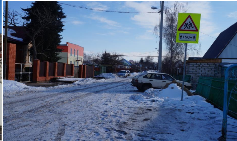
ул. Мира - подход с северной стороны