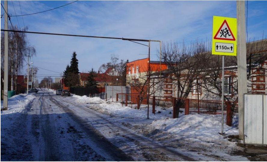
ул. Мира - подход с южной стороны